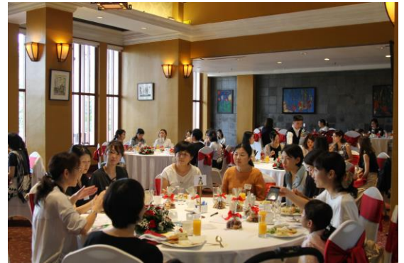
終始和やかな雰囲気での会が進みました。

クリスマスムードに彩られた会場で、参加者の皆さんの笑顔弾ける楽しい会となりました。