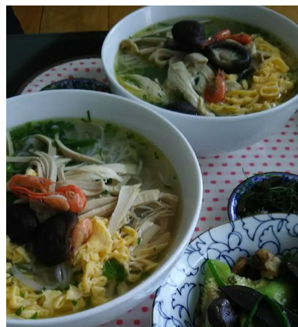
完成したBun Thangはとても美味でした

こんな現場を見ちゃったら、鶏肉食べられないよ…と思ったけれど、このために潰されてしまった鶏さんです。食べないわけにはいきません。ありがたく、頂戴いたしました。食べてみたらいつも買っている肉よりも引き締まった肉質で、味が濃く大変に美味でした。