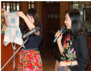
上：ハンドクラフトボランティアサークル