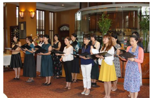
左：Xuan Voceの皆さんが美しい歌声を披露